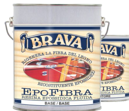
Latta da 4 Lt.