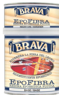
Latta da 750 ml.